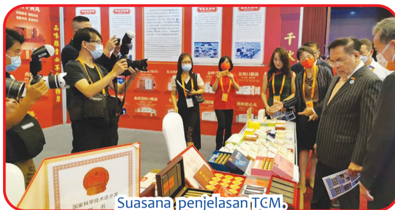
Suasana penjelasan TCM.

Mantan Sekjen PBB, Mr. Ban Ki-moon juga secara khusus menyampaikan surat ucapan selamat kepada pihak penyelenggara forum. • idn/din