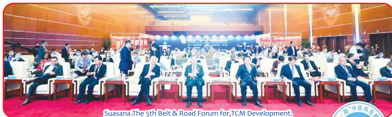
Suasana The 5th Belt & Road Forum for TCM Development.