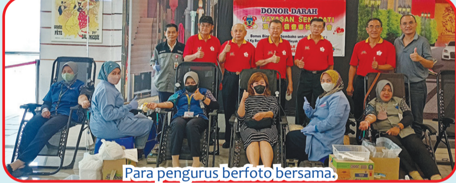
Para pengurus berfoto bersama.