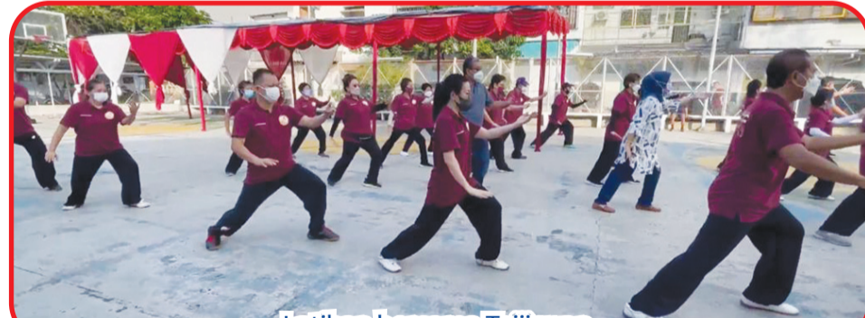
Latihan bersama Taijiquan.